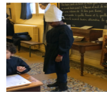
Un travail non réussi c'était le bonnet d'âne !