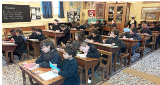
Une classe ... comme dans les années 1920.