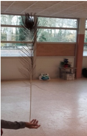
La plume de paon

Les classes de CM2 ont commencé le projet cirque avec Thomas de la compagnie Crokocirk. Nous faisons du jonglage en nous servant de différents instruments :