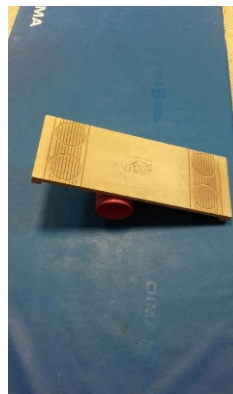
Le rola bola