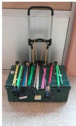
Les bâtons du diable